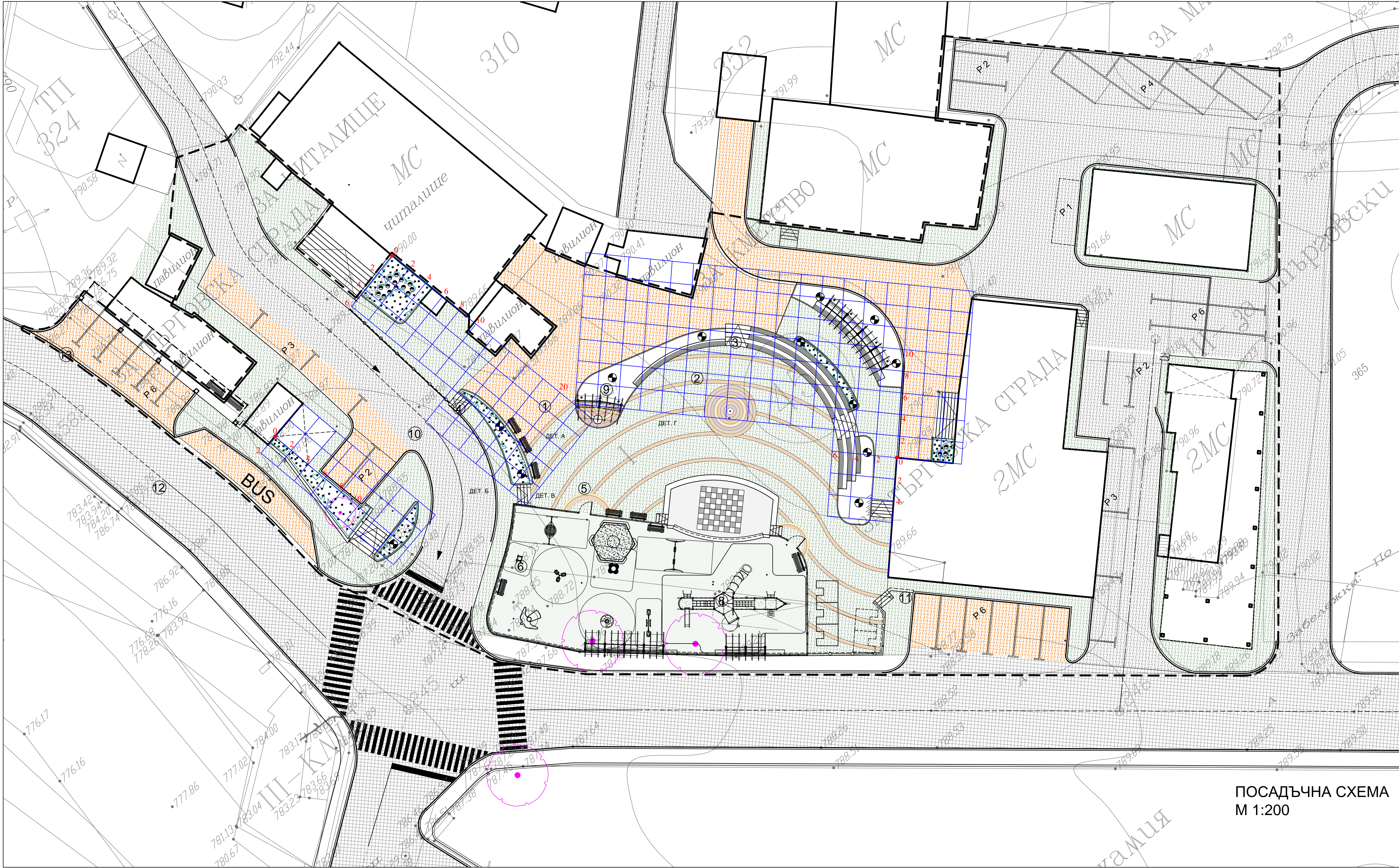
ПОСАДЪЧНА СХЕМА М 1:200